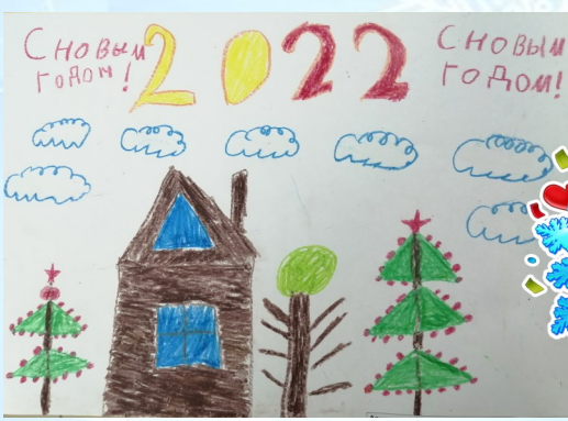
Большанский Руслан, Аристархов Кирилл, 4 "Б" кл.