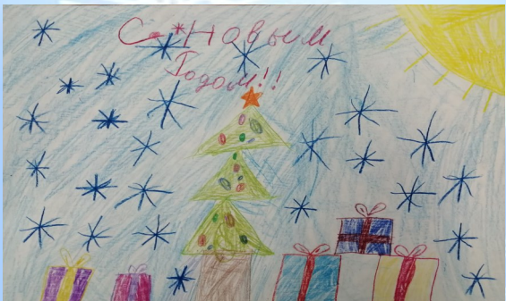
Леонтьева Катя, 4 "Б" кл.