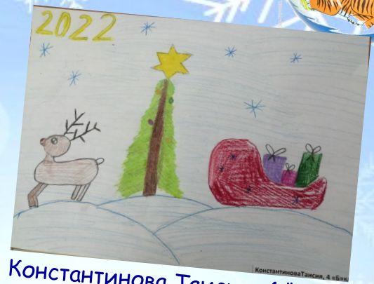
Константинова Таисия, 4 "Б" кл.