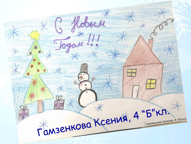
Гамзенкова Ксения, 4 "Б" кл.