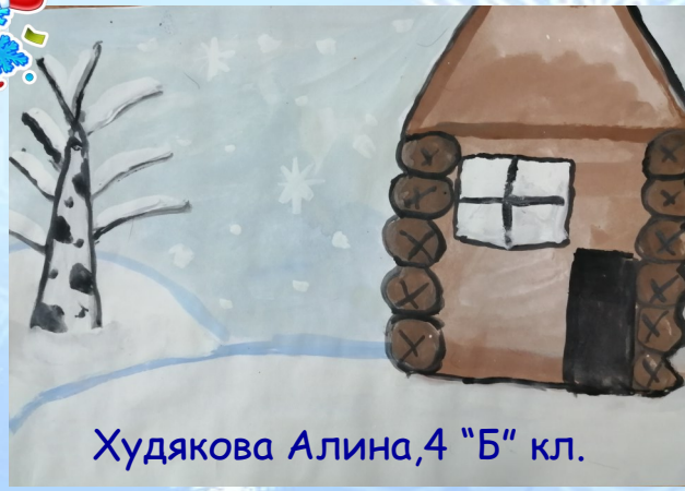
Худякова Алина, 4 "Б" кл.