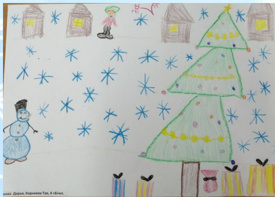
Ионова Дарья, Корнеева Тая, 4 "Б" кл.